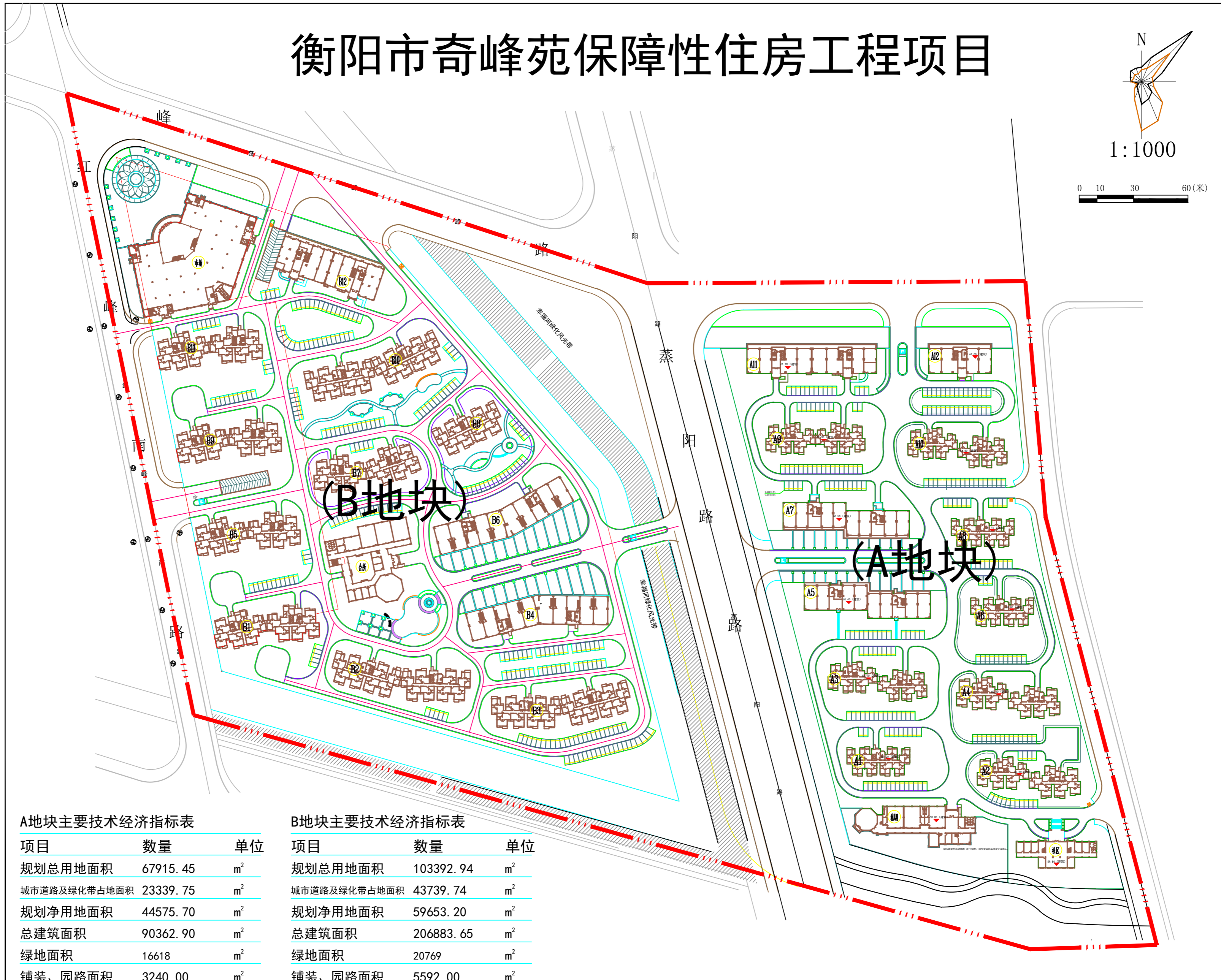
A地块主要技术经济指标表